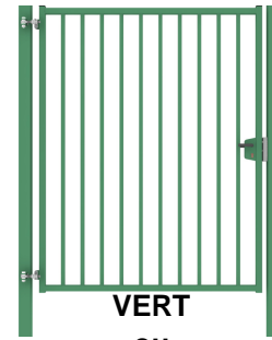
VERT ou GRIS ANTHRACITE